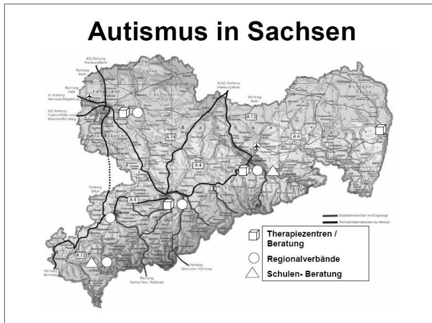
Abb. 3: Autismus in Sachsen

Die exemplarisch genannten schulischen Hilfssysteme in Sachsen (vgl. Abb. 3) sind trotz ihrer hohen Qualität und des großen Engagements noch uneinheitlich organisiert und nicht flächendeckend im Bundesland Sachsen verankert.